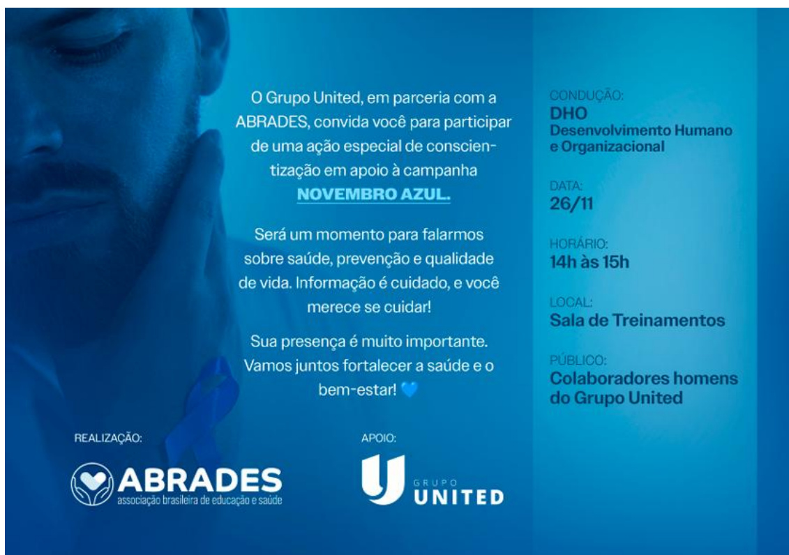
Figura 3 - Material institucional de divulgação da ação educativa realizada no âmbito da campanha Novembro Azul – 2025