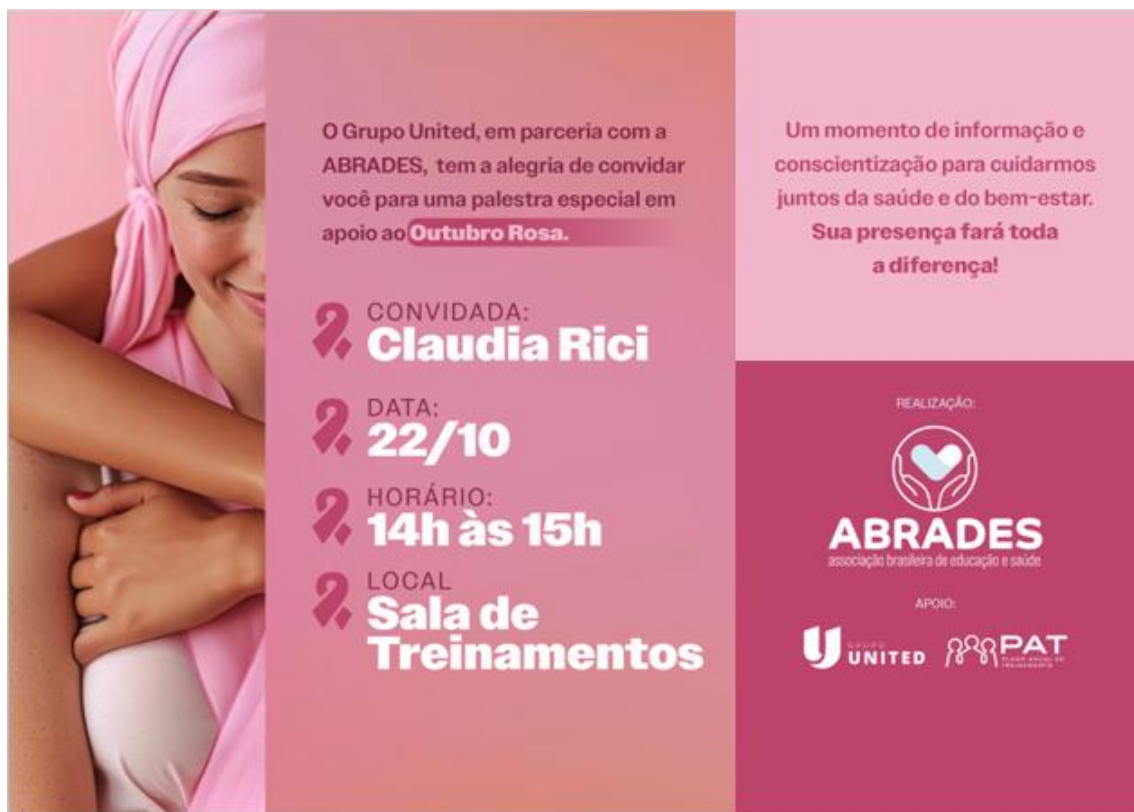
Figura 2 - Material institucional de divulgação da palestra educativa realizada no âmbito da campanha Outubro Rosa – 2025