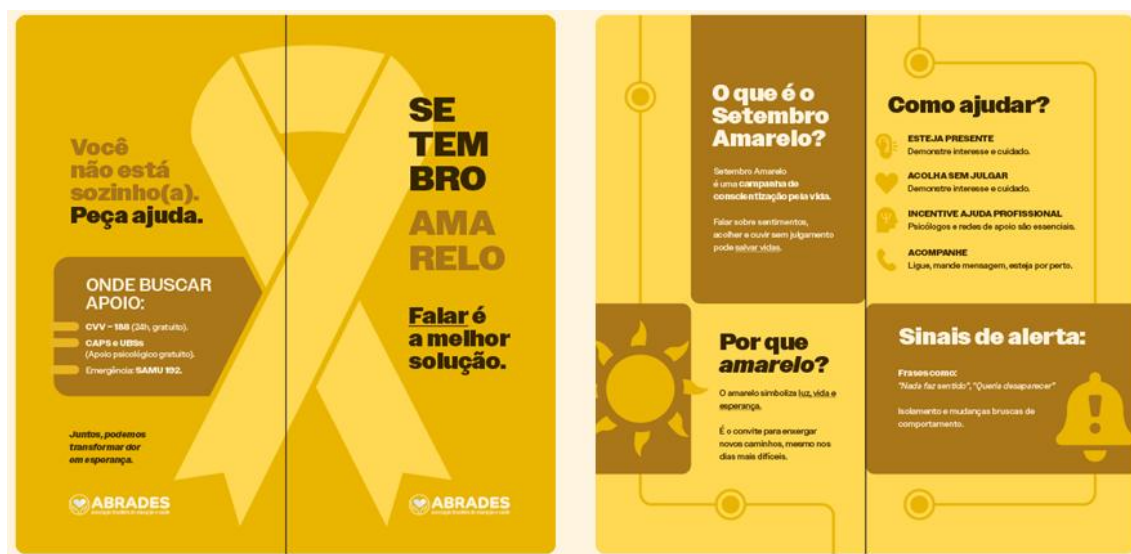
Figura 1 - Material educativo institucional desenvolvido pela ABRADES para a campanha Setembro Amarelo – 2025

As iniciativas voluntárias desenvolvidas em setembro ampliaram o alcance social da atuação da ABRADES para além das obrigações assistenciais previstas contratualmente, fortalecendo a promoção da saúde mental e o acesso à informação qualificada junto à comunidade.